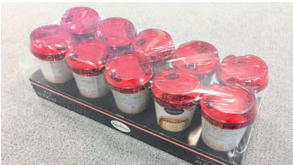
Auf einem Tray werden jeweils zehn Milchdrinks eingeschweißt.

Zum Einsatz können verschiedenen Verpackungsarten wie Seitenschweißung, Überlappungsschweißung unten oder oben, Ionisierung oder Trennschweißung kommen. Unabhängig von Produkt und Abmessungen, wird ein optimales Verpackungsergebnis mit unterschiedlichsten Folien erzielt, ob dünne Folien für die Verkaufsverpackung mit oder ohne Zielbedruckung oder äußerst strapazierbare Folien für Transportverpackungen.