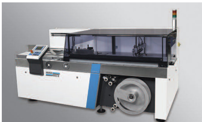
Kontinuierliche Schlauchbeutelmaschine Servo X 5 mit Längsschweißung für eine Leistung von bis zu 5.000 Takten pro Stunde.

Es gibt zahlreiche Möglichkeiten, die Technik mit Optionen wie Perforierung für leichtes Öffnen, Anleger zum Auf- oder Einspenden von beispielsweise Beipackzetteln, Aufreißfaden, Folienwechselautomat und Aufhängeverpackungen auszurüsten. Die Produktzuführung erfolgt manuell oder automatisch mit gleichen oder unregelmäßigen Abständen mittels Highspeed-Eintaktung.